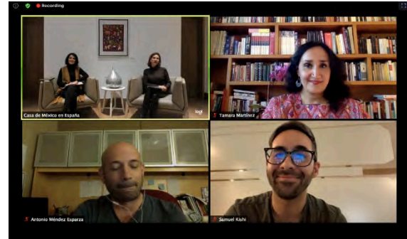
Fotografías: Homenaje a Miguel León Portilla en Casa de América. Inauguración Ciclo de cine y diálogos "Traslados. Migración y género"