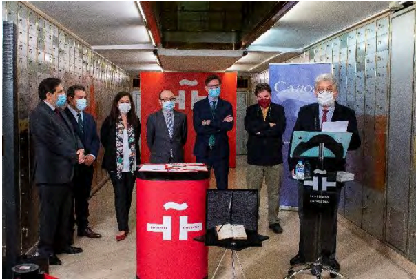
Foto: Homenaje a Andrés Bello, depósito de legado en Caja de las Letras Instituto Cervantes. Red Canoa