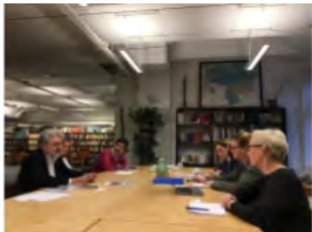
El director de la sede en reunión con funcionarios de la Universidad de Estocolmo

El Centro de Estudios Mexicanos UNAM-España llevó a cabo una serie de acciones para fomentar la vinculación institucional en México, España y otros países europeos. Destacaron las reuniones de trabajo mantenidas por el comité ejecutivo de la red Canoa, órgano en el que la UNAM ostenta la secretaría pro tempore , y las gestiones para la incorporación a la red de la Universidad de Buenos Aires y la Secretaría de Cultura del Estado de Jalisco. Se sostuvieron reuniones con las fundaciones universitarias de la Universidad de Salamanca y Complutense de Madrid, con el